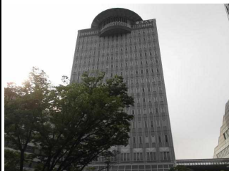
地上16階建ての2号館

さて、今回訪れた白山キャンパスは文京区にあり、都営三田線の白山駅から徒歩5分という東京のど真ん中と言っていい場所だ。今から10年前(2005年)に東洋大学は文系学部をここに集め4年間一貫教育を始めた。いわゆる「都心回帰」と呼ばれる方針の先駆けで、これにより志願者が増加したため他の私立大も追随することになった。