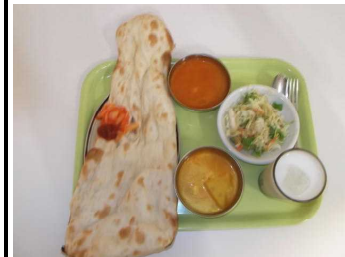
ハーフ&ハーフのカレーランチ。ナンがトレーからはみ出す!

昼前に到着したのに結構混んでいる6号館地下の学食は巨大フードコートであった。カレー、パスタ、洋食、鉄鍋、トルコ料理等々7つもの店舗があり、それぞれの店舗前には食券販売機で食券を買ってカウンターで待っている店員に渡す仕組み。驚くことにどの店舗も基本は500円のセットで、