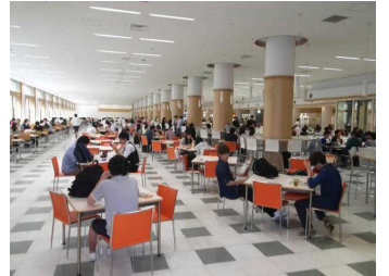
学食ランキング第1位の学食

どこにしようか迷ったあげく、インド人のおじさんが微笑んでいるカレー屋に決め、ハーフ&ハーフのセット(500円)の食券を購入。食券を渡すと「ナン、ご飯?」と聞くので「ナン!」と言うと、もう一人の店員が専用釜でナンを焼き始めたのではないかと。さらに「ウーロン茶、ラッシー?」と聞くので「ラッシー!」と答え、「カレーどれ?」と聞かれ「チキンとベジタブル」と答えると、トレーにはカレー2種とラッシーとサラダと焼きたての大きなナンがドカン。さて実食。うまいっ! この本格的インドカレーがワンコインなのは信じられない…。やはり学食ランク1位は素晴らしい!