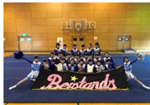
チアリーディング部 全国大会出場