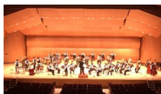
吹奏楽部 西関東吹奏楽コンクール 銀賞