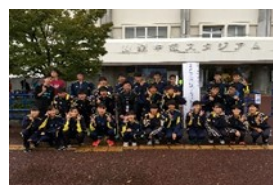
陸上競技部 全国大会出場