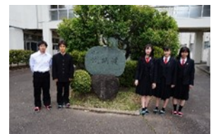
水泳同好会 関東大会出場