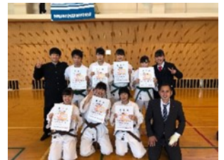
少林寺拳法部 全国大会出場