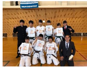
少林寺拳法部 全国大会出場