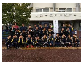
陸上部 関東大会出場