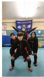
ボクシング部 全国大会出場