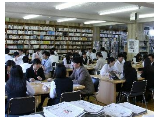
公開みらい学 (同窓生ら社会人を講師に招いた座談会)