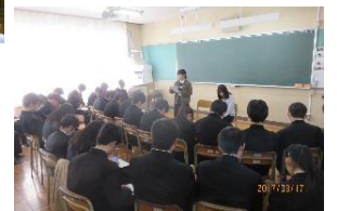
卒業生からのアドバイス (卒業生が受験体験談などを紹介)