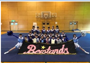
応援リーダー部 全国大会出場