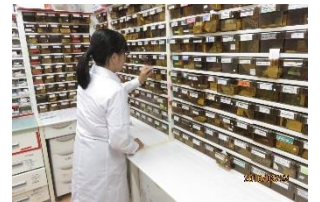
インターンシップ (普通科高校では先駆的な取組)

この Project を通して、校訓の示す「誠 (誠実) ・ 明 (明知) ・ 健 (健康)」を兼ね備えた、心身ともに健康で国際的視野を持つ、心豊かな人間を育成します。