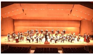
吹奏楽部 西関東吹奏楽コンクール銀賞