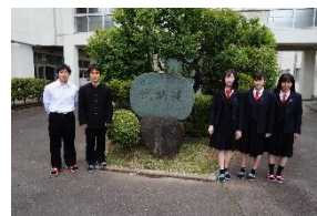
水泳同好会 関東大会出場