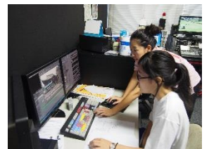
インターンシップ (普通科高校では先駆的な取組)

この Project を通して、校訓の示す「誠 (誠実) ・明 (明知) ・健 (健康)」を兼ね備えた、心身ともに健康で国際的視野を持つ、心豊かな人間を育成します。