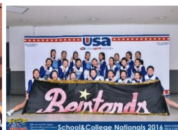
応援リーダー部 USA Nationals in Japan 2016 第2位