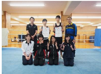
ボクシング部 関東大会出場