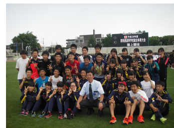
陸上部 関東大会出場