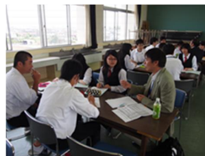
公開みらい学 (同窓生を講師に招いた座談会)