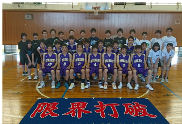
男子バスケットボール部 関東大会出場