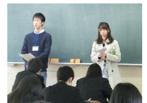
先輩からのアドバイス (卒業生が受験体験談などを紹介)