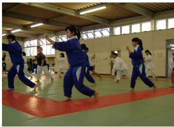
少林寺拳法部 全国大会出場