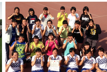
女子テニス部 団体 県総体第3位 ダブルス 県総体準優勝