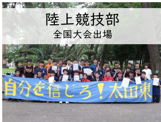
陸上競技部 全国大会出場