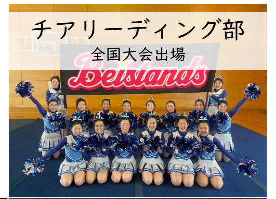
チアリーディング部 全国大会出場

吹奏楽, JRC, 生物・化学, 写真, 茶道, 美術, ESS, 地歴研究, 書道, 軽音楽, 情報処理同好会