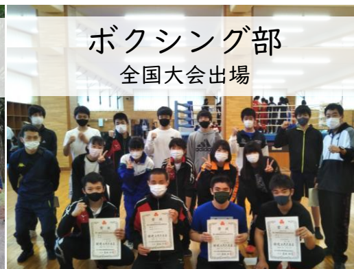
ボクシング部 全国大会出場