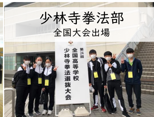
少林寺拳法部 全国大会出場