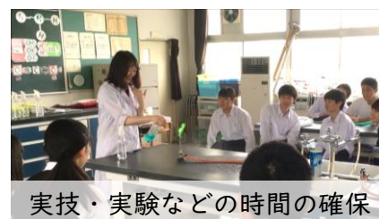
実技・実験などの時間の確保