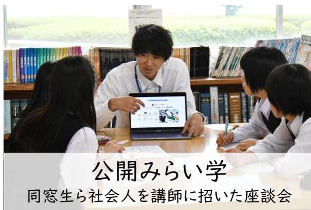
公開みらい学 同窓生ら社会人を講師に招いた座談会