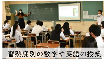
習熟度別の数学や英語の授業