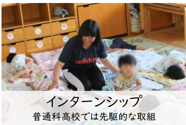
インターンシップ 普通科高校では先駆的な取組

この Projectを通して、校訓の示す「誠(誠実)・明(明知)・健(健康)」を兼ね備えた、心身ともに健康で国際的視野を持つ、心豊かな人間を育成します。