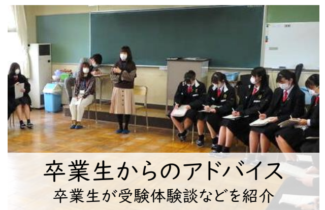
卒業生からのアドバイス 卒業生が受験体験談などを紹介