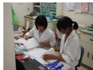
インターンシップ (普通科高校では先駆的な取組)

この Project を通して、校訓の示す「誠(誠実)・明(明知)・健(健康)」を兼ね備えた、心身ともに健康で国際的視野を持つ、心豊かな人間を育成します。