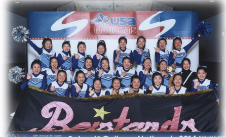
応援リーダー部 USA Nationals in Japan 2015 第3位