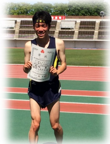
陸上部 関東大会出場