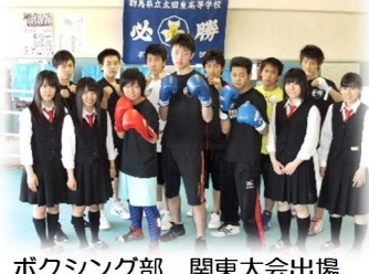
ボクシング部 関東大会出場