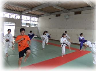
少林寺拳法部 全国大会出場