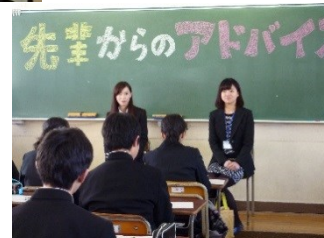
先輩からのアドバイス