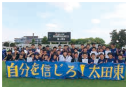
陸上競技部 全国大会出場