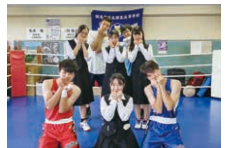
ボクシング部 全国大会出場