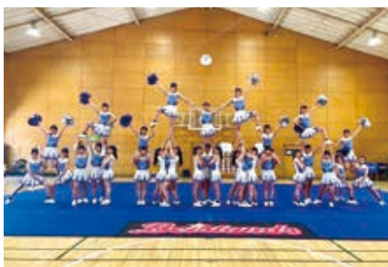
チアリーディング部 全国大会第3位