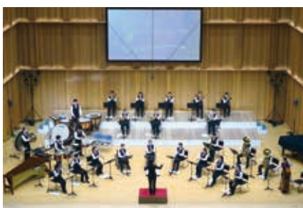
吹奏楽部 全国総合文化祭出場 (鹿児島)