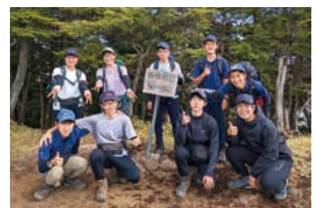
登山部 関東大会出場