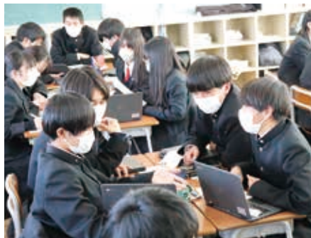
総合的な探究の時間

授業時のペアワークやグループワークの際には、 男女共学のよき伝統・自由な発想 が、積極的なやりとりを生かされ広い視野から深い理解につながっていきます。