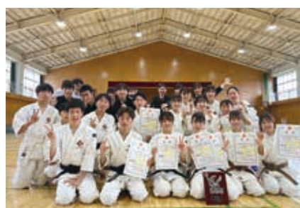
少林寺拳法部 全国大会出場