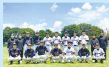
ソフトボール部 (関東大会出場)