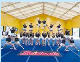
チアリーディング部 (全国大会第3位)