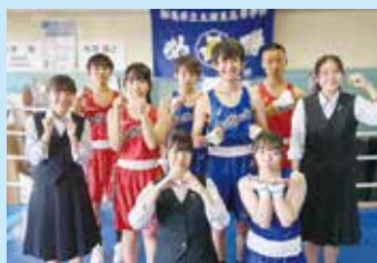
ボクシング部 (全国大会出場)