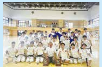
少林寺拳法部 (全国大会出場)