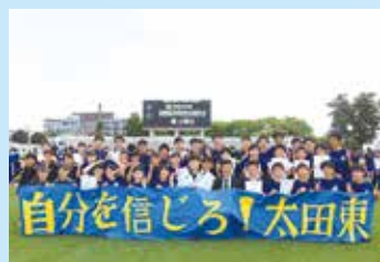
陸上競技部 (全国大会出場)