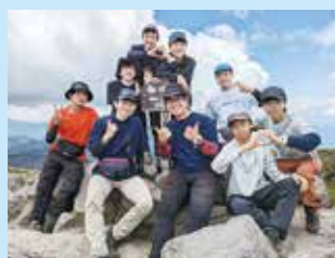
登山部 (関東大会出場)