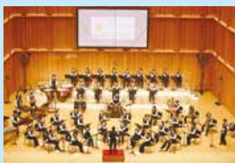
吹奏楽部 (全国高等学校総合文化祭出場)