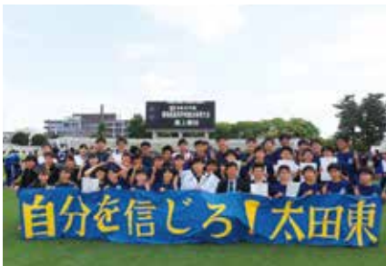
陸上競技部 全国大会出場