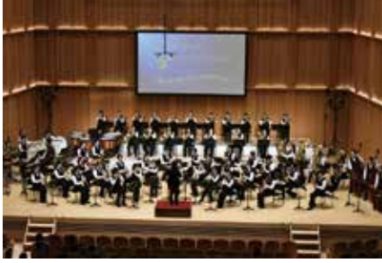
吹奏楽部 西関東吹奏楽コンクール 銀賞受賞