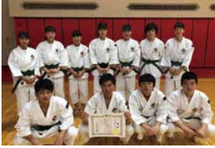
少林寺拳法部 全国大会出場