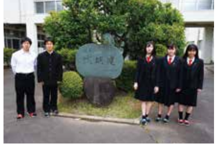
水泳同好会 関東大会出場