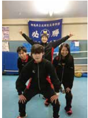
ボクシング部 全国大会出場