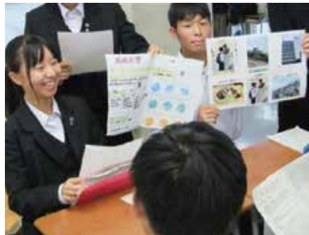
総合的な探究の時間(大学訪問発表)

授業時のペアワークやグループワークの際には、 男女共学のよき伝統・自由な発想 が、積極的なやりとりで生かされ、広い視野や深い理解につながっていきます。