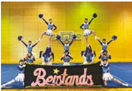
チアリーディング部 全国大会出場